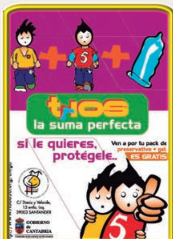
Campaña de prevención (año 2004)