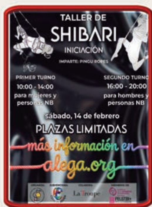
Cartel de la actividad de Shibari en ALEGA

Uno de mis principales objetivos desde entonces ha sido romper con el estigma que rodea al shibari. Muchas personas siguen viéndolo únicamente como una práctica sexual o lo relacionan con ideas superficiales heredadas de 50 sombras de Grey. Esa visión no representa lo que yo vivo en las cuerdas.